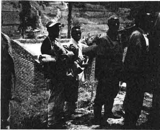
Les commerçants ne font pas de grandes affaires.