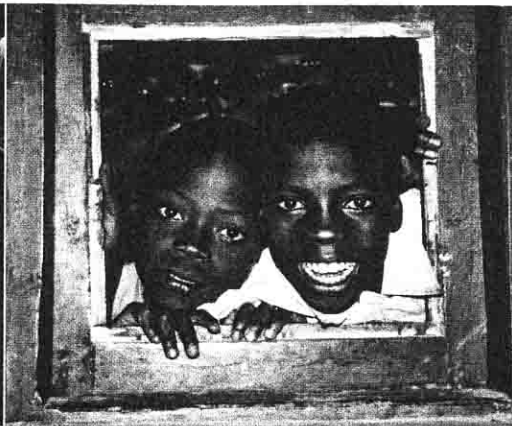
Un rien suffit à faire briller les yeux des enfants.

service en 1975 et s'épanouissent rapidement. Au 1.1.2001, elles étaient 145 réparties à travers tout le pays et fortes de 230 000 membres. En 1984, le supplément magazine du «Tages-Anzeiger» commente ainsi ce mode de coopération: «L'assistance à l'auto-développement et le soutien des couches de population les plus démunies, deux des piliers de la philosophie Raiffeisen, recouvrent exactement les principes directeurs de la coopération suisse au développement».